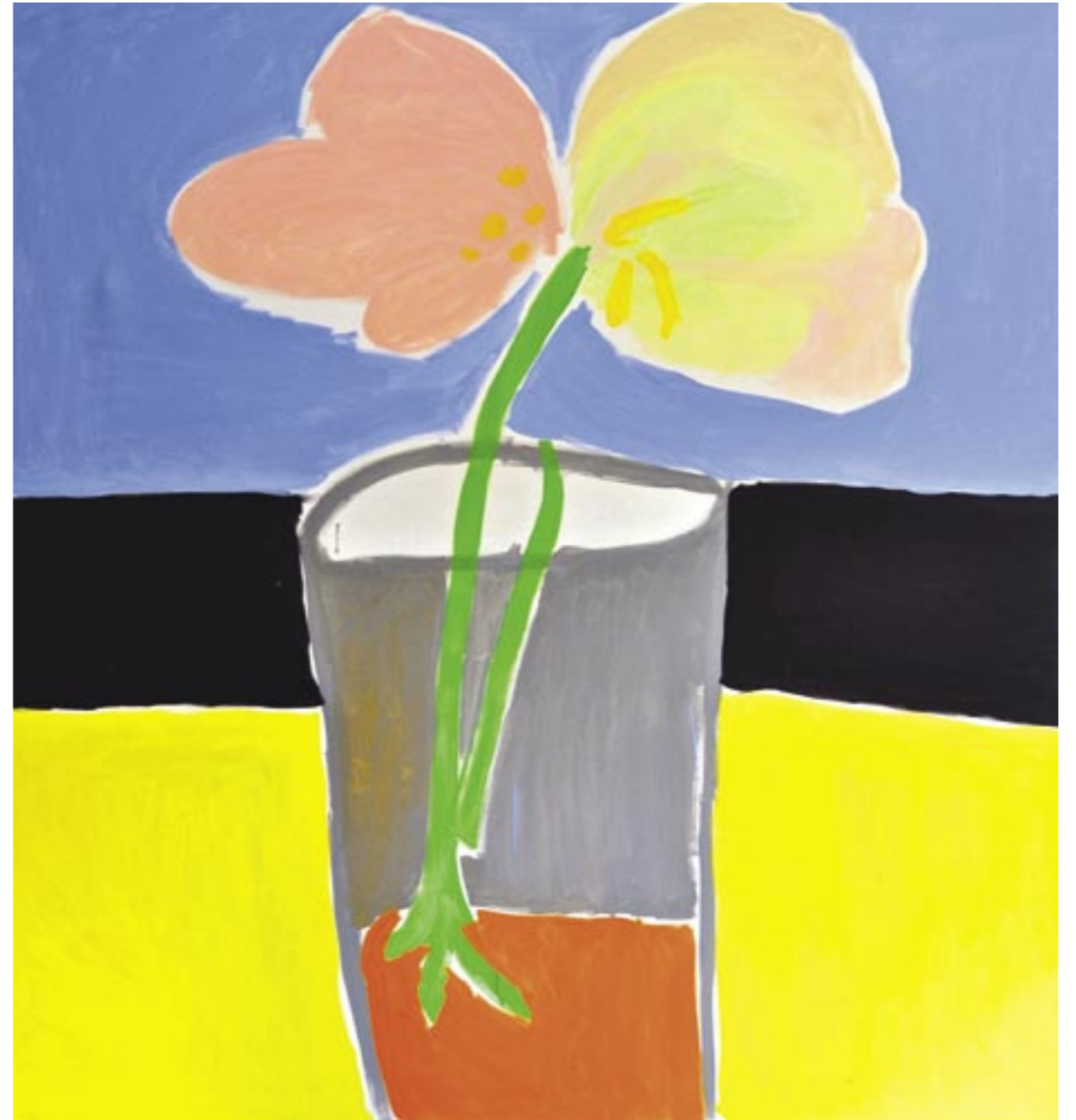
Blume, 2014 Acryl auf Leinwand, 170 x 160 cm