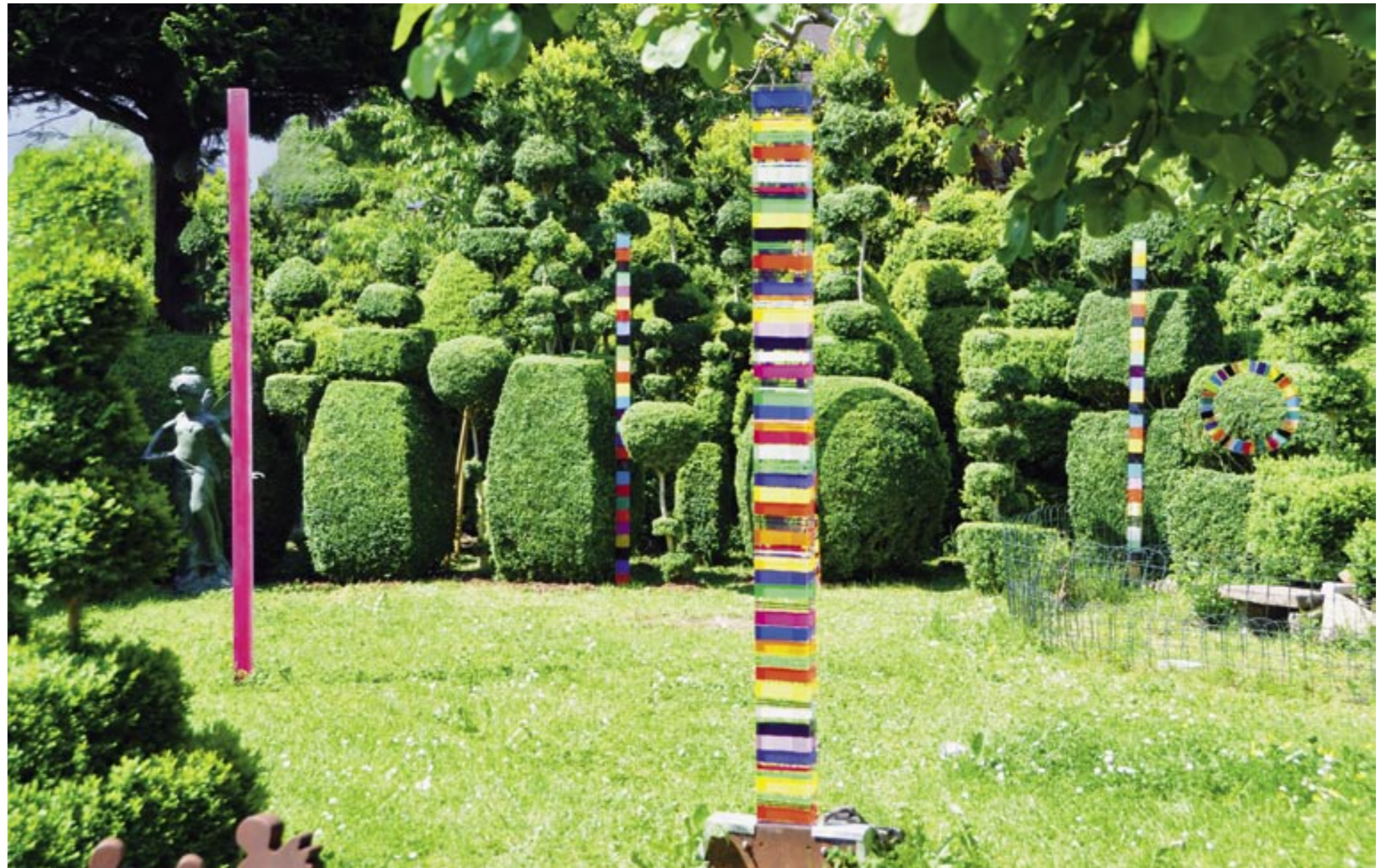
Buchgarten mit Acrylglasstelen