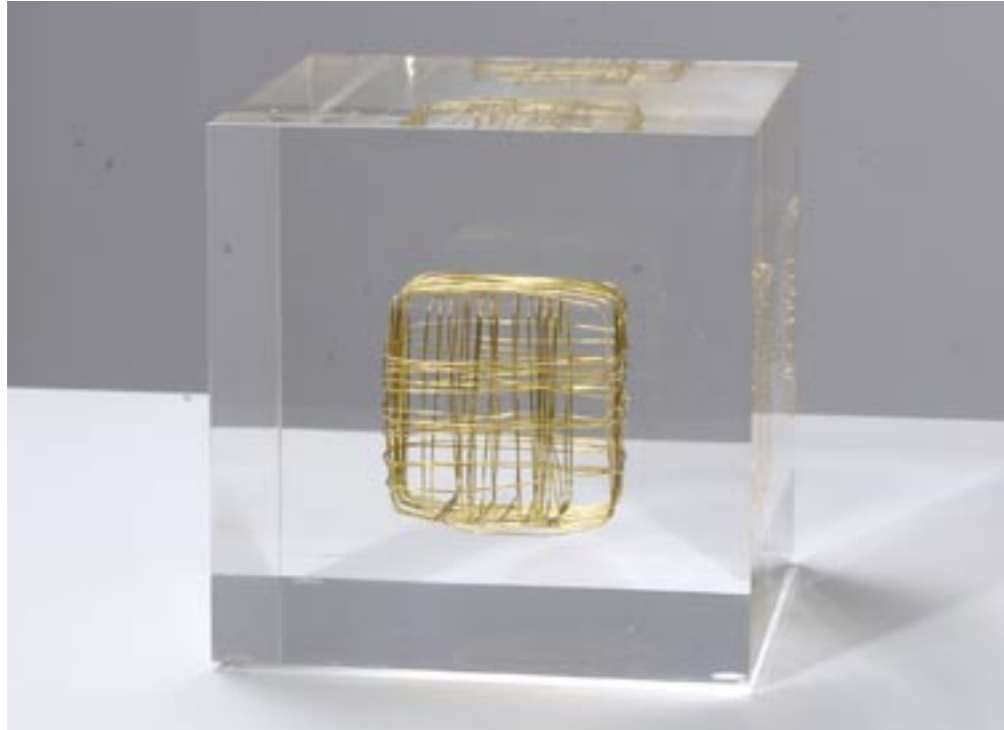
Würfel in Würfel, 2013 Draht in Acrylglas eingegossen, 10 x 10 x 10 cm