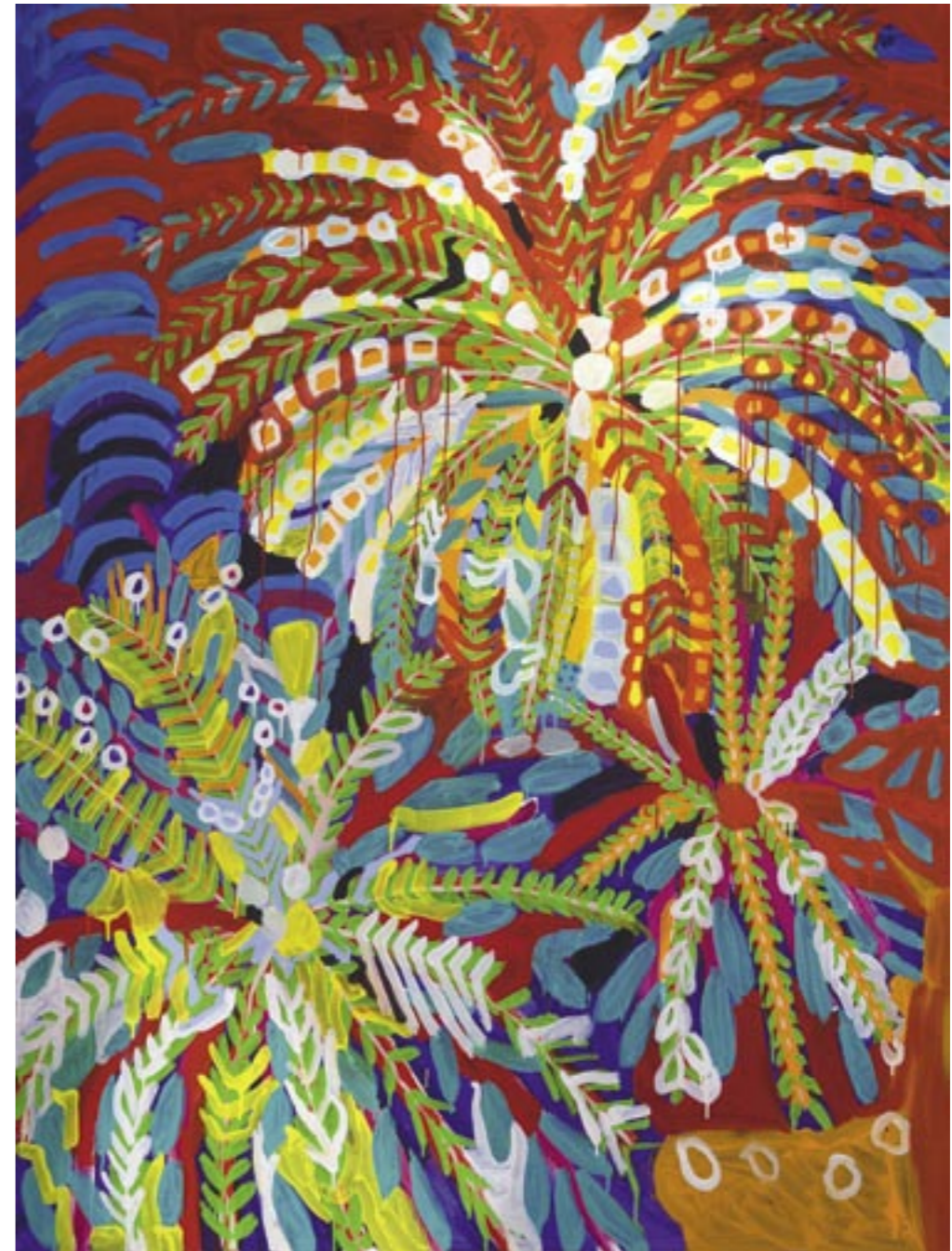
Palmenblumen, 2014 Acryl auf Leinwand, 200 x 150 cm