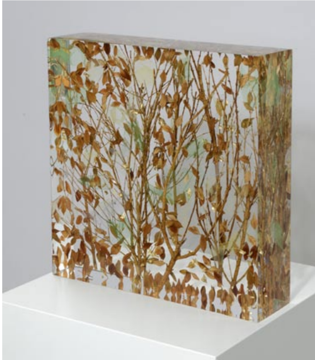
Wundergarten, 2013 Buchs, Tüll und Gold in Acrylglas eingegossen, 33 x 33 x 8,5 cm