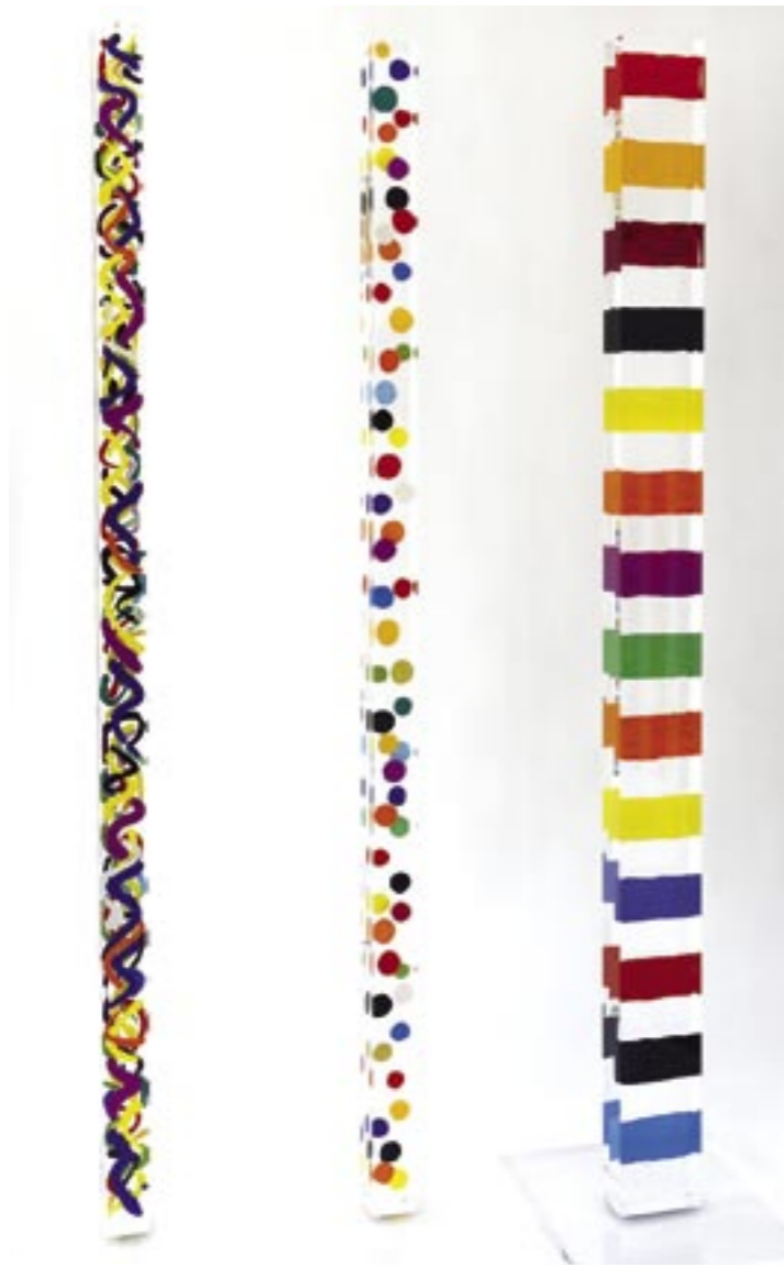
Atelierfoto, Stelen, Acrylglas, Malerei auf zwei Seiten eingegossen, von links: