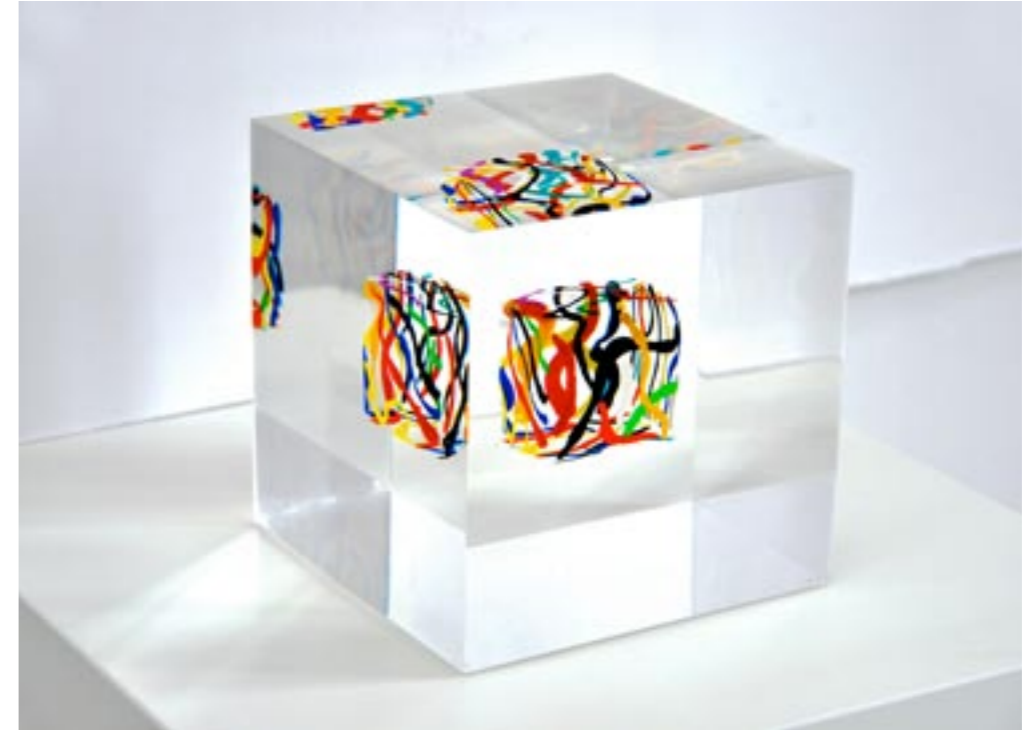
Würfel in Würfel, 2012 Würfel in Acrylglas eingegossen, 15 x 15 x 15 cm