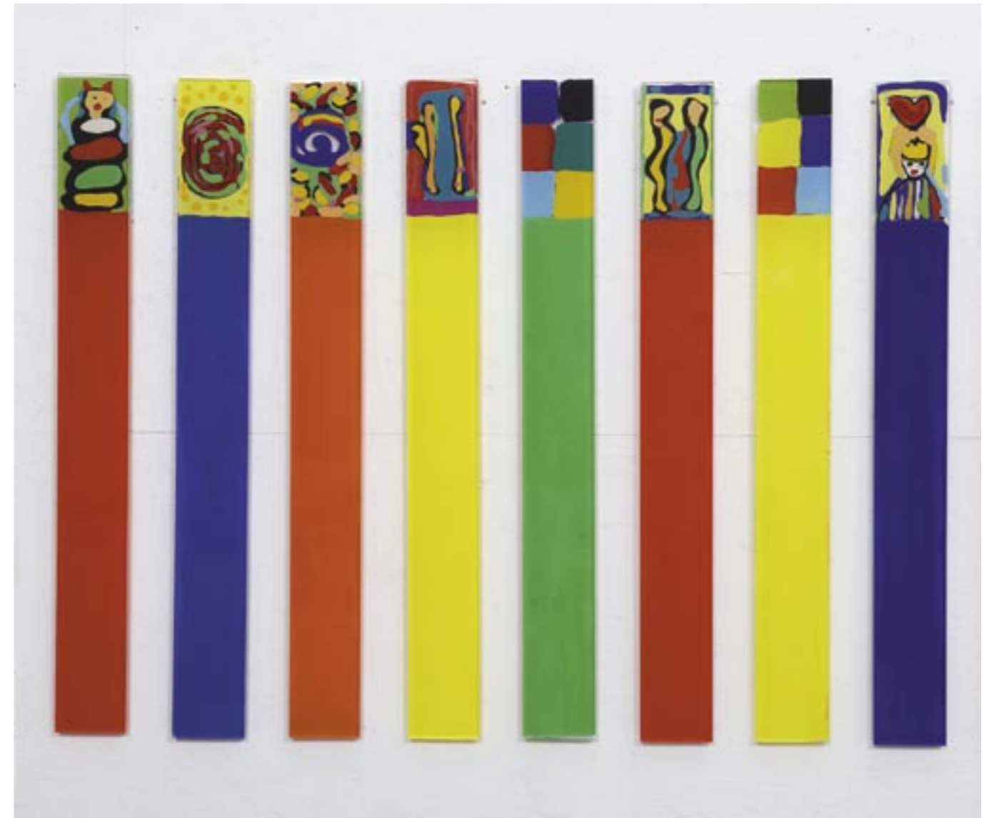
Atelierfoto, Jardin Magique, 2013 Acrylglas, Malerei eingegossen, je 72 x 3,5 x 1,5 cm

von links: Nr. 51, 48, 42, 2, rot, 43, 46