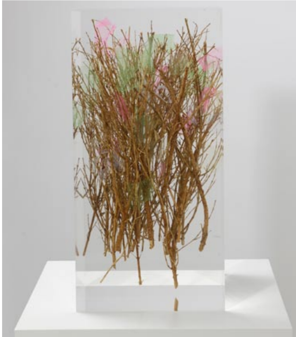
Blumenstrauß, 2014 Buchs, Tüll und Gold in Acrylglas eingegossen, 40 x 19 x 20 cm