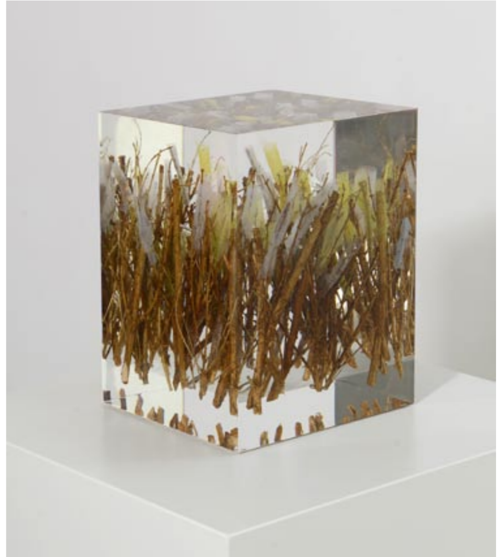
Blumenstrauß, 2014 Buchssteckli und Tüll in Acrylglas eingegossen, 22,5 x 16 x 16 cm