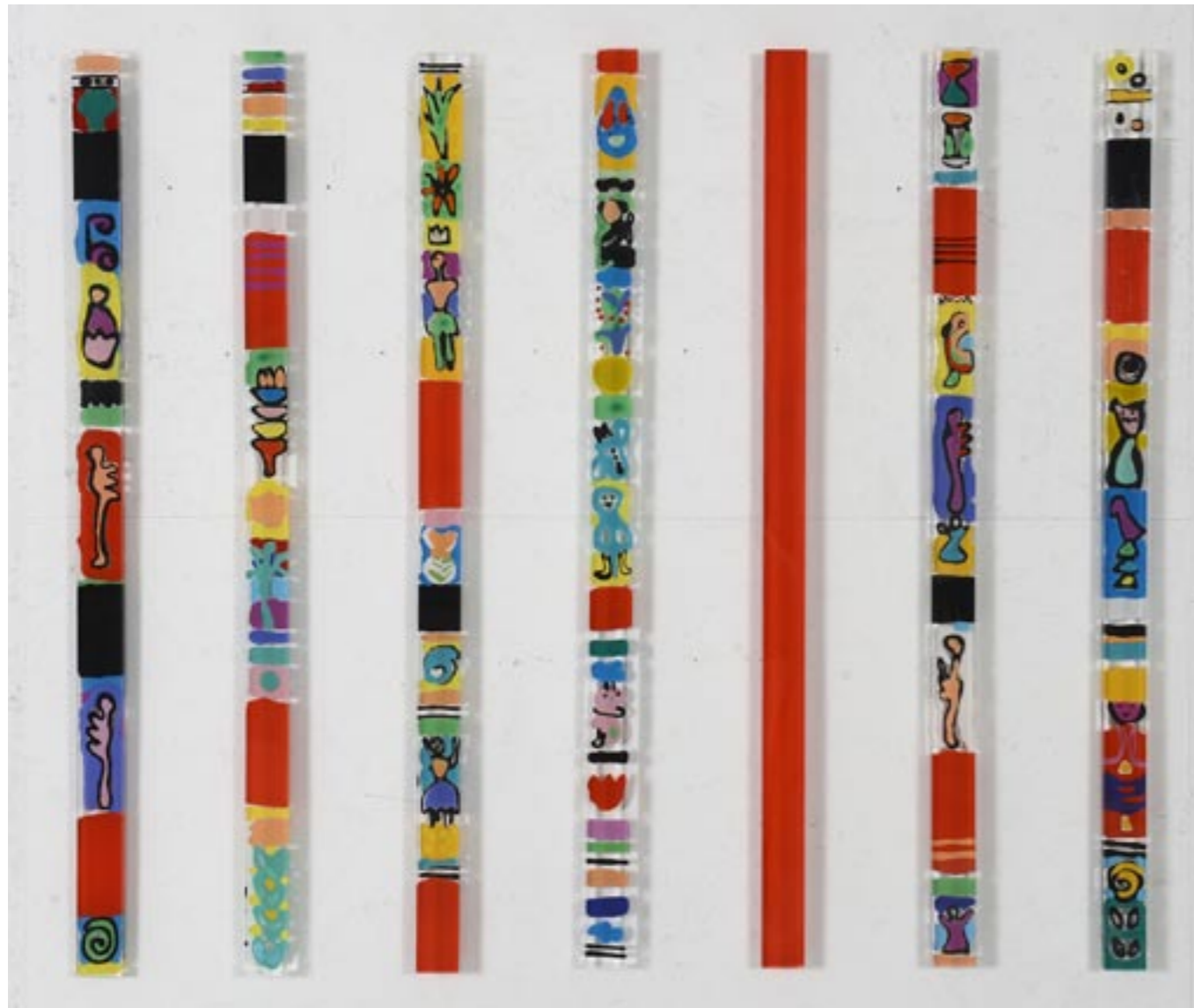
Atelierfoto, Bâton Magique, 2012 Acrylglas, Malerei eingegossen, je 72 x 3,5 x 1,5 cm

von links: Nr. 51, 48, 42, 2, rot, 43, 46