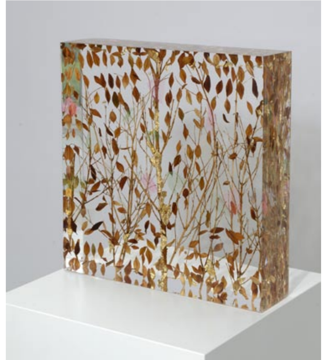
Wundergarten, 2013 Buchs, Tüll und Gold in Acrylglas eingegossen, 34 x 33 x 8 cm