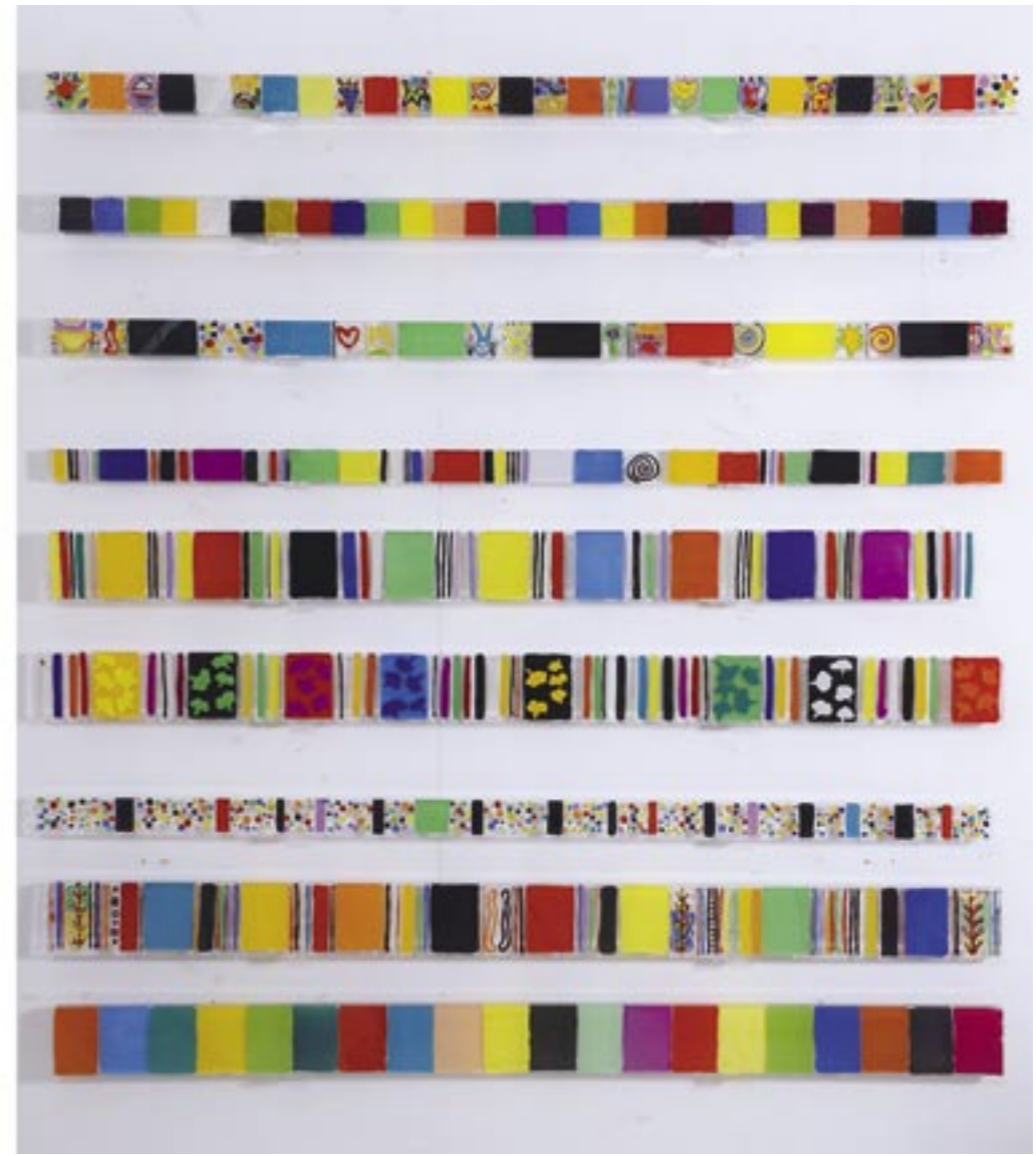
Atelierfoto, Fries, Acrylglas, Malerei auf zwei Seiten eingegossen, von oben: