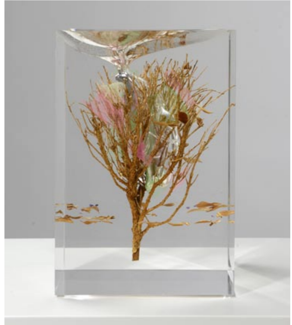
Blumenstrauß, 2014 Buchs, Tüll und Edelsteine in Acrylglas eingegossen, 23,5 x 16 x 16 cm