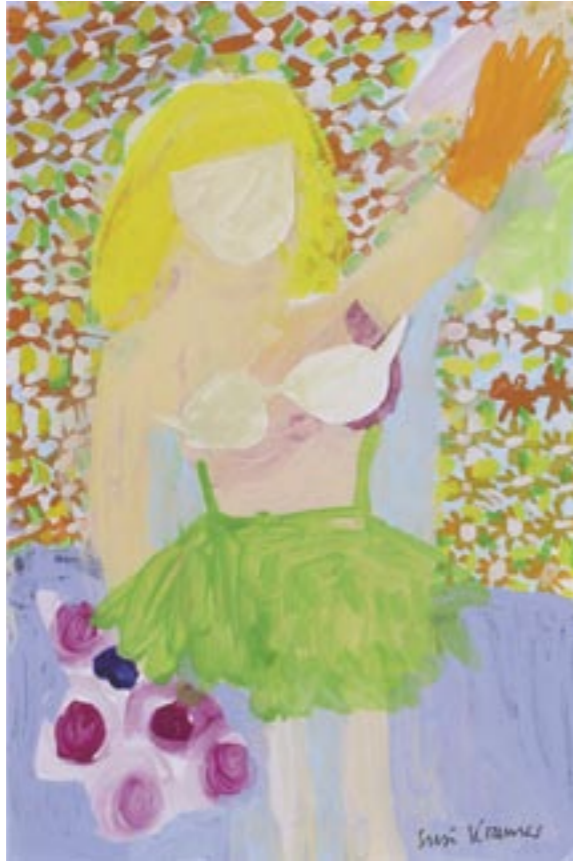
Frau, 2014 Acryl auf Canson-Papier, Bild 24 x 16 cm